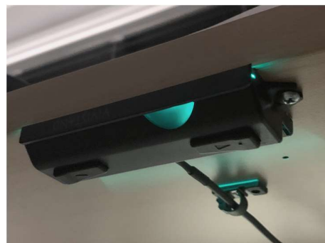
上下翻转，用力塞入